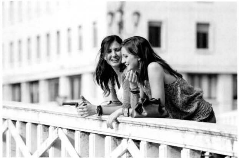
Über Reisen sprechen S. 16

Suffixe -ник, -ниц(а), -ист, -ист(ка), -тель, -тельница(а)